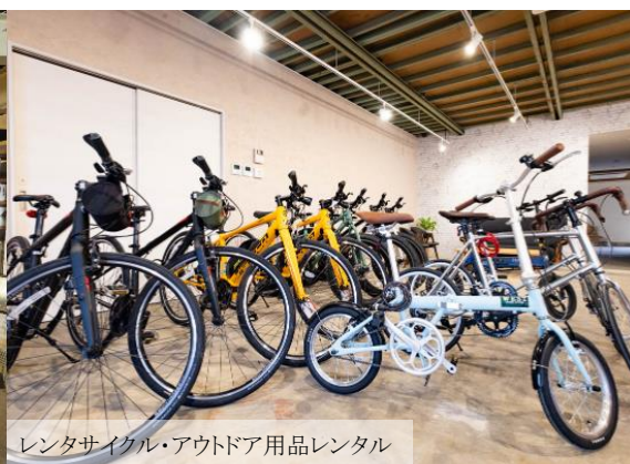
レンタサイクル・アウトドア用品レンタル