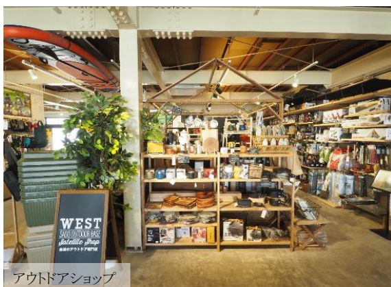
アウトドアショップ

『ジャパントラベルアワード 2023』で「感動地」としても認定された佐渡アウトドアベースは、佐渡の玄関口「両津港佐渡汽船ターミナル」より徒歩 4 分に位置し、自然とアウトドアを愛するすべての人に向けた便利な拠点です。サイクリング、カヤック、トレッキング、キャンプ、釣り、トライアスロンなど、佐渡で楽しめるアクティビティが手ぶらでお楽しみいただけます。