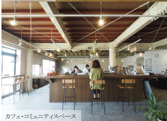
カフェ・コミュニティスペース