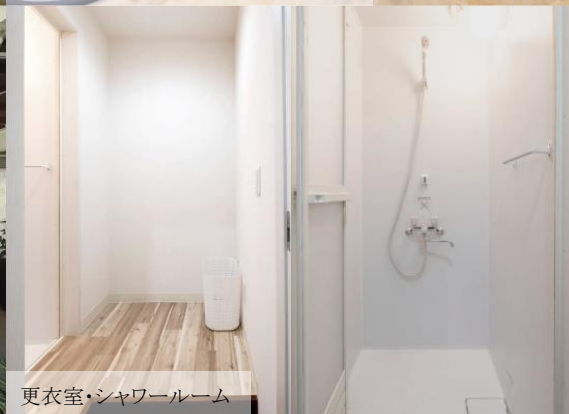
更衣室・シャワールーム